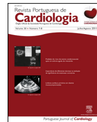
IMAGEM EM CARDIOLOGIA