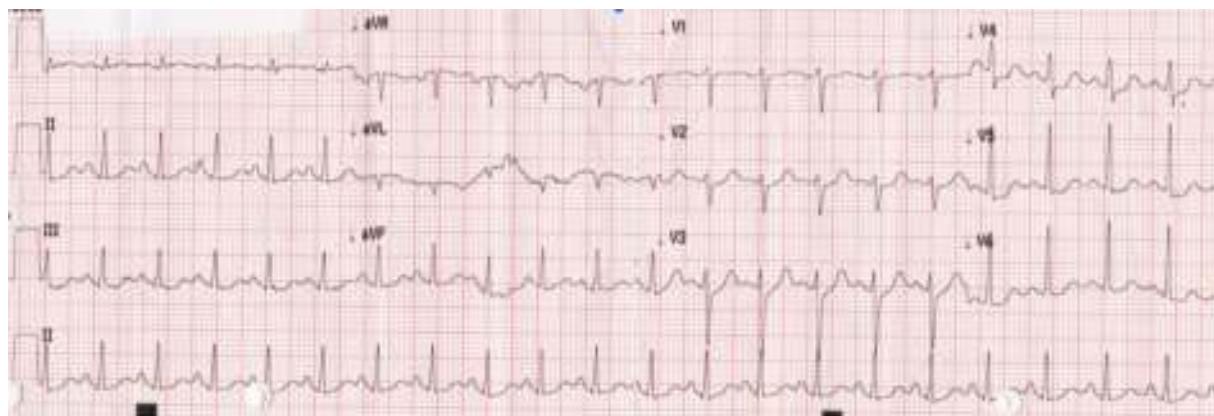
Figura 4 Eletrocardiograma: taquicardia sinusal, infradesnívelamento ST em V4 e V5.