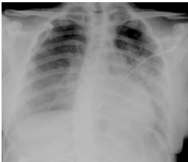
Figura 1 Radiografia de tórax à admissão: edema pulmonar agudo.