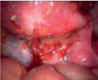
Figura 2 - Imagem de Laparoscopia (sexto caso clínico) (Hospital Prof. Dr. Fernando Fonseca, Amadora, Portugal). Imagem sugestiva de implantes pélvicos e complexo tubo-ovárico bilateral com obliteração do fundo de saco de Douglas.