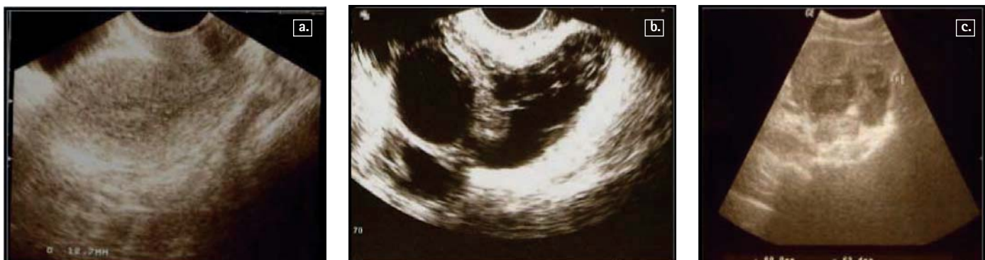
Figura 1 - Imagens de Ecografia Ginecológica dos casos clínicos (Hospital Prof. Dr. Fernando Fonseca, Amadora, Portugal).

a. Na ecografia ginecológica é visível uma área central de ecoestrutura heterogénea, com espessamento endometrial de 12.7mm (terceiro caso clínico);