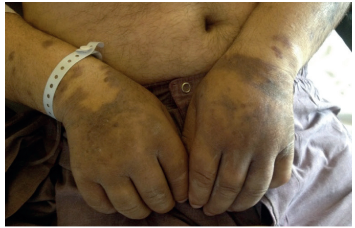
Figura 2: Púrpuras dispersas com relevo, descamativas e violáceas nos membros superiores.

O SK é um tumor endotelial multicêntrico com baixo grau de malignidade, considerado raro até ao início da epidemia da SIDA. A partir de 1981, a sua incidência aumentou consideravelmente sobretudo em doentes homossexuais (SK epidémico associado ao HIV). Em 1994, descobriu-se a participação de um vírus do grupo herpes (HHV-8 ou SKHV) na etiopatogenia do SK. 8 Estudos mais recentes mostram três factores mais implicados na sua etiopatogenia: a infecção pelo HIV, a infecção pelo HHV-8 e o papel das citocinas. 4 A partir de 1996, nos doentes com infecção pelo HIV, a introdução da terapia anti-retroviral combinada (HAART) resultou na redução significativa do número de novos casos de SK epidémico. O SK endémico ocorre em toda a África equatorial, particularmente a subsaariana. Acomete crianças e adultos,