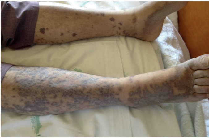
Figura 1: Púrpuras dispersas com relevo, descamativas e violáceas, 1 a 2 cm de diâmetro nos MI

direita, descamativas e violáceas com prurido, evoluindo para a região plantar, perna esquerda, coxas, membros superiores e escassas no tronco associada a perda ponderal de 10 kg em 6 meses motivo pelo qual recorreu ao hospital. Negava febre, anorexia, mal estar geral, osteomioartralgias, disfagia ou odinofagia, náuseas ou vômitos, alteração do trânsito intestinal e discrasia hemorrágica. Negava queixas de outros aparelhos e sistemas.