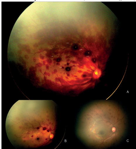
Figura 2 – Retinografias obtidas com Retcam3® (Clarity Medical Systems) do fundo ocular de ambos os olhos do 1º Caso, aos 6 dias de vida.

pia hemorragias intraretinianas profundas nos 4 quadrantes em ambos os olhos, centradas no disco óptico (Fig. 2). Apresentava ainda em menor número, hemorragias na camada de fibras nervosas (em chama de vela). A avaliação analítica não mostrou trombocitopénia ou alterações da coagulação.